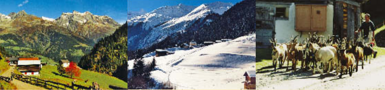
Zu allen Jahreszeiten ein traumhaftes Ferienziel