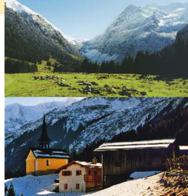
Val – die Sonnenterrasse des Val Sumvitg

Dabei wollen wir nicht vergessen, das ausgezeichnete Bergbeizli vis-à-vis des Maiensässes, die «Ustria Val» zu erwähnen, das für seine Bündner Spezialitäten weit herum bekannt ist. Wintersportfreunde finden in der näheren Umgebung viele